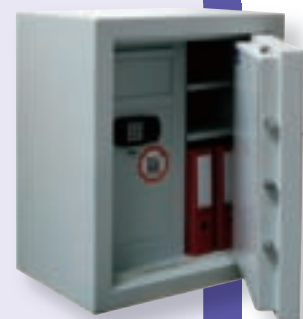
NS II/4 Deposit

Valeur de recouvrement Euro/CEN classe 2: € 40.000