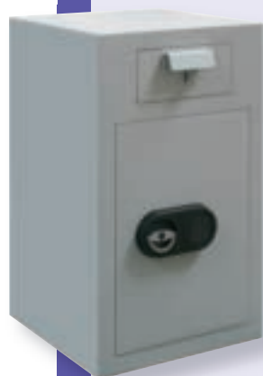
ET D 3

La poignée de porte de 25 mm n'est pas comprise dans la profondeur extérieure indiquée (MPE)