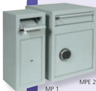
MP 1 MPE 2