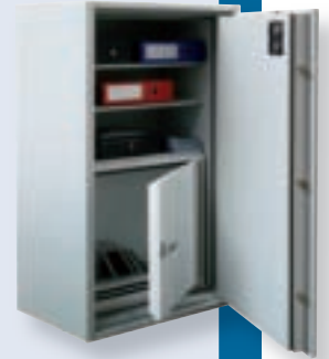
Koln 4 + databox

Cadre télescopique pour dossiers suspendus pour modèles 4-14